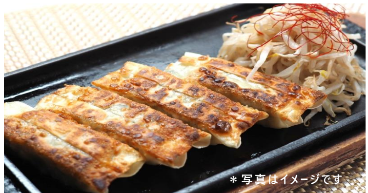
棒餃子 880 円