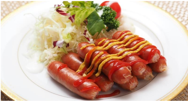
ボイルドウインナー 750 円