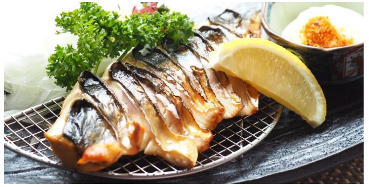
鯖 さば の燻製 990 円