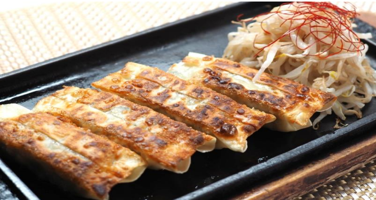
棒餃子 880 円