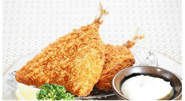
アジフライ(2尾) 880 円