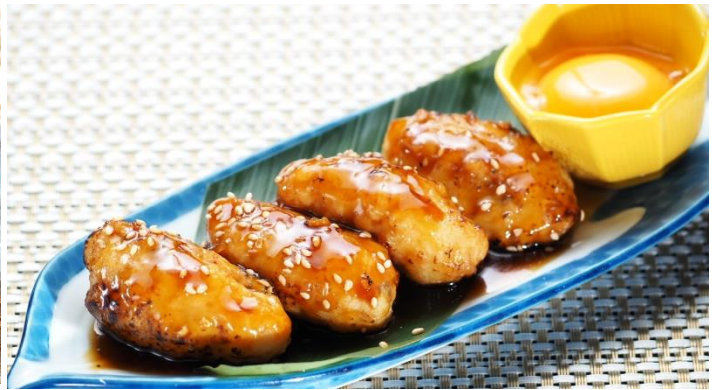
つくねの照焼 780 円