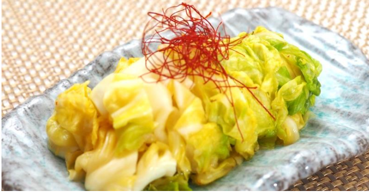
ハルピン漬け 660 円